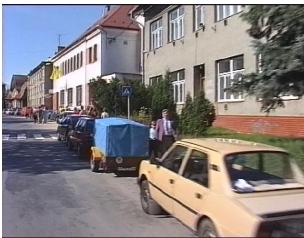
Foto ze záznamu LTV Příbor rok 2000, mateřská škola ještě stojí, ale už v ní děti nejsou...

V roce 1999 město ukončilo provoz v mateřské škole.