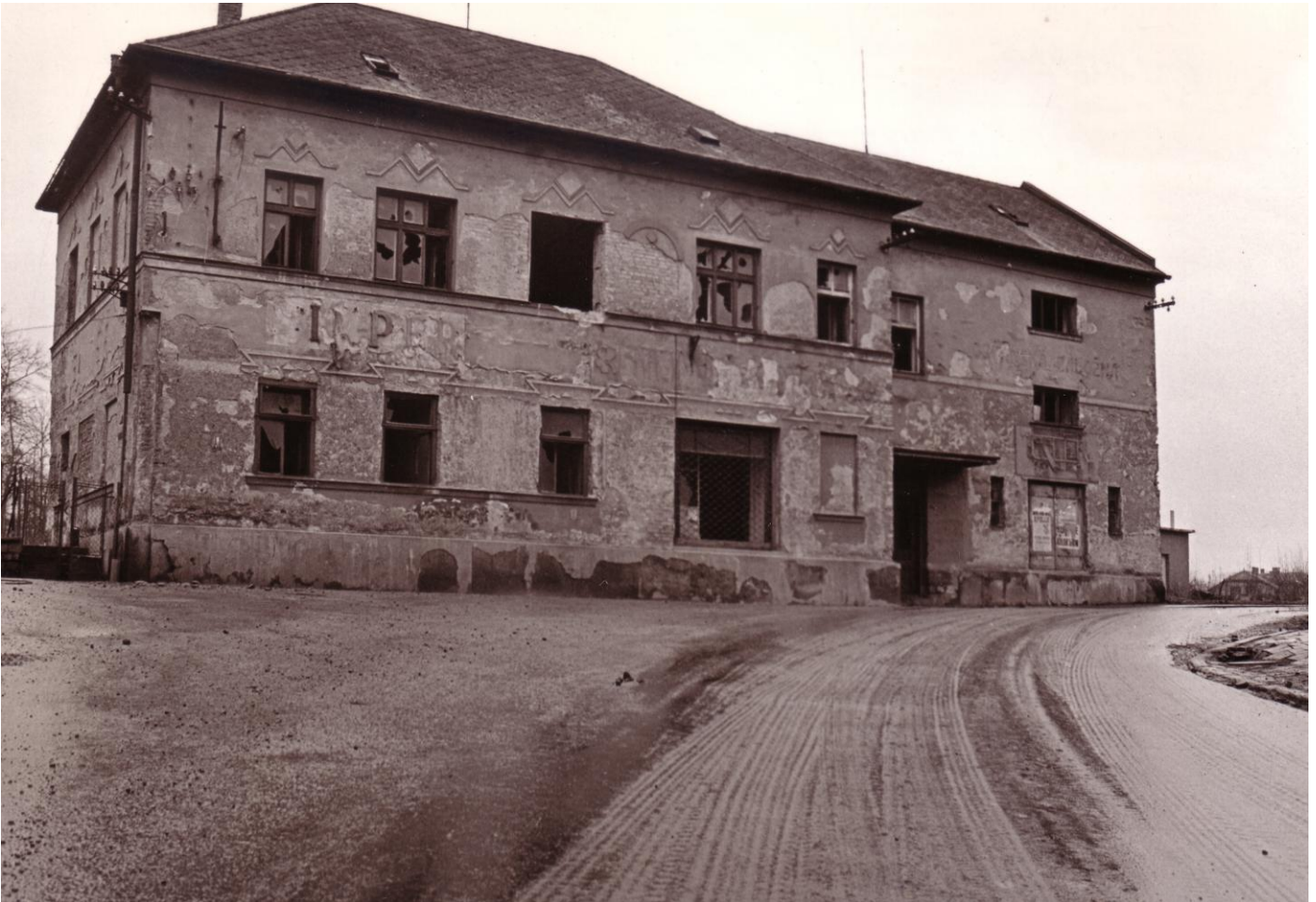
uvádí se rok 1974, jinde 1979